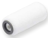
Elite Midi 10 cm

Double Coat Filtröller är vår populäraste premiumroller (svensktillverkad) och en finns i många olika storlekar. Rollern bär mer färg så du får upp mer färg på ytan att jobbat med.