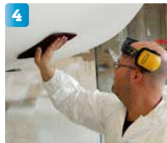
Finslipla bort revor från det grovre sandpapperet med Scotch Brite-duk.