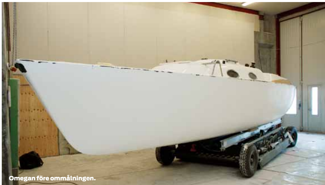
Omegan före ommålningen.