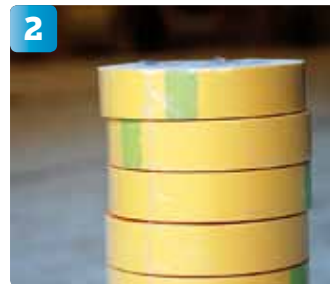
Avgränsa ytor som inte ska målas med en bra maskeringstejp som är lättanvänd och ger raka färglinjer.