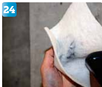
Rengör med klibbduk (se steg 7).