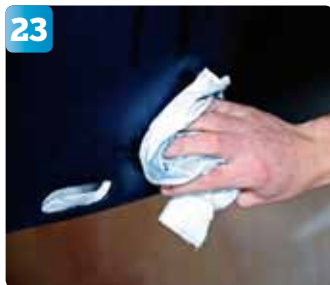
Torka torrt med ren trasa.