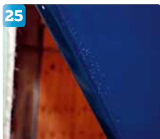
En ren yta är helt avgörande för slutresultatet. Prickarna på bilden är rester av silikon som använts för att avlägsna gjutformarna.