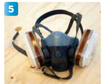
Använd kolfiltermask, handskar och heltäckande klädsel (giftiga ångor från lösningsmedel i lacken).