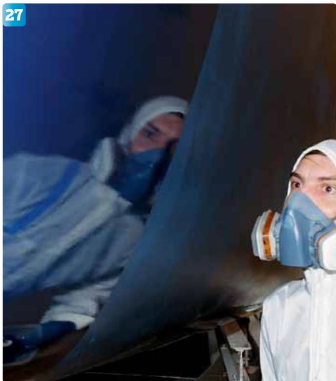
Var extra noggrann vid lager två. Beroende på temperatur har du några minuter på dig att rätta till rinningar och torrfläckar.