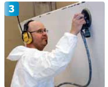
Mattslipla skrovet med maskin, välj grovlek på sandpapper utifrån skicket på gelcoaten (P180-240).